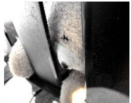
Aliénation - photographie

Reproduction des œuvres interdite sans l'autorisation de l'artiste © Julie Turconi