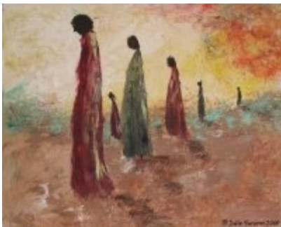
Exode – techniques mixtes