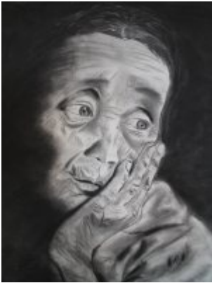
Contemplation - fusain

Julie Turconi Photographie, peinture, fusain