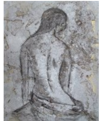
Chimère – techniques mixtes