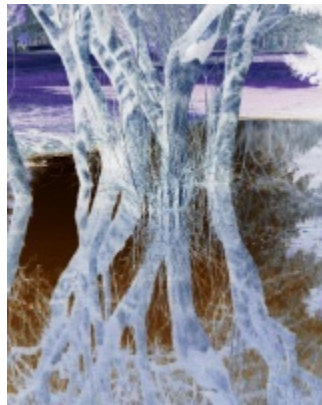
Fantasmagorie – photographie